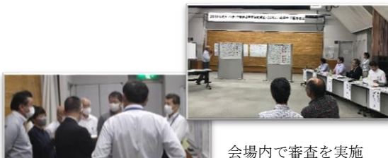
会場内で審査を実施