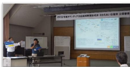
申請団体は、審査員・来場者の前でプレゼンテーションをします。