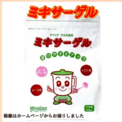
画像はホームページからお借りしました

株式会社宮源「ミキサーゲル」 加熱・冷却の手間なく、混ぜるだけでゲル化が可能。700g 4,989円