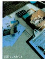
計算もしっかりと