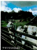
ヤギたちもお出迎え