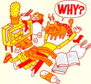
なかなか部屋が片付かない