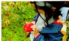
うまく色がついたかな？慎重にシールをはがす子ども