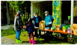
検温と体調確認。密にならないよう参加者の流れをコントロールした受付

長野県の特別警報発令となってしまった中、本来は中止にするところ、参加者オリジナルの文字絵リンゴ収穫があったため、参加者をグルーピングした上で、接点を極力減らした運営で開催しました。長野地域子どもカフェプラットフォームから借り受けた非接触型温度計やアルコール等の資材をフル活用して実施。今回の場が「Withコロナの活動」の実践となり、来年への活動へつながる貴重な挑戦の機会となりました。