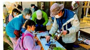
参加者と一緒にクラフトに取り組む山楽会のみなさんと作品