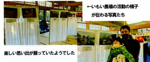
←いもい農場の活動の様子が伝わる写真たちが伝わる写真たち