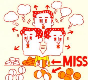
注意力が散漫してしまい 何度も同じミスをしてしまう