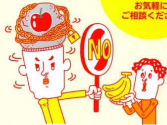
独自の考え方や、こだわりが強い