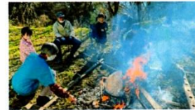
↑焼きマッシュマロを楽しむ参加者ら

焚火企画を長野市安茂里地区等で実施しているさとやまネット信州さん。今回のお楽しみ企画の一つとして、焚火体験を開催していただきました。