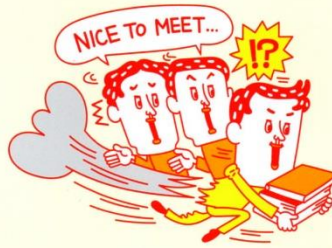
空気がよめず人との コミュニケーションが苦手