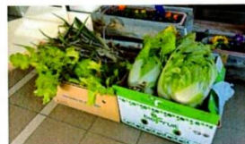
同日、精神保健ボランティア「ホワイトナッツ」さんへ、野菜を寄贈しました。野菜は、翌日の活動で活用されました。