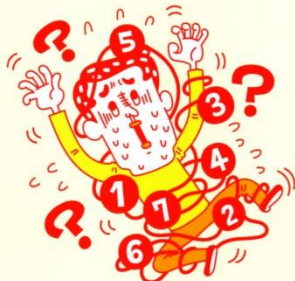
順序立てて取り組むのが苦手