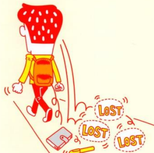
忘れ物・失くし物が多い