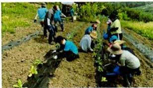
ハクサイを植え付ける参加者ら

一般参加の参加者を交えて、ハクサイ約75苗を定植し、ダイコンと聖護院ダイコンの種まきを行いました。ハクサイの植穴には、8月は雨がほとんど降らなかったため、水をたくさん浸み込ませてから苗を植え付け、秋野菜を育てる初日としました。