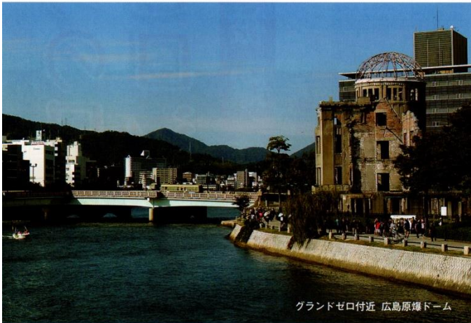
グランドゼロ付近 広島原爆ドーム

戦争の記憶をもたない世代が 社会の大半を占める今 日本人にしかできないこと 日本人だから しなければならないこと 「知る」 「語り継ぐ」 そして、立場をこえて理解し、 尊重しあい、 ふだんのくらしの中で、 私たちができることは何か 一緒に考えてみませんか？