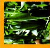
とうもろこし 味菜