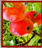
りんご マジックアップル.....